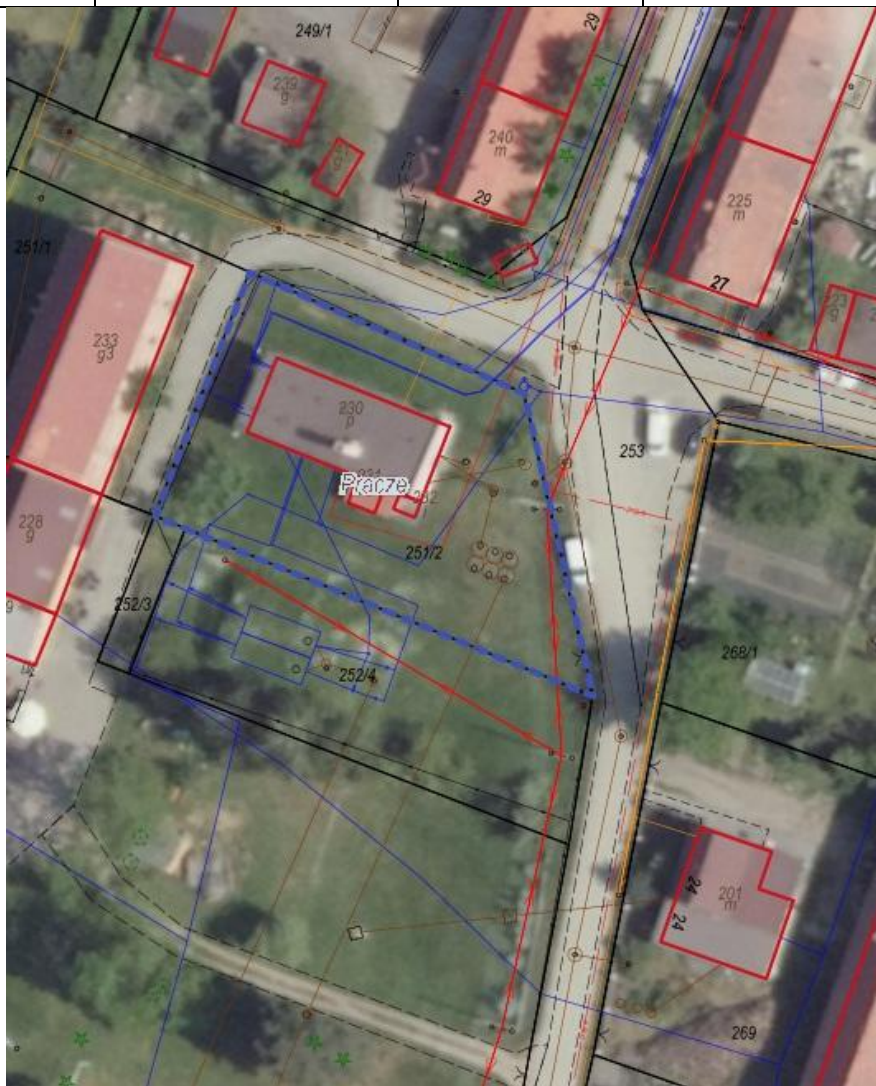
Budynek przemysłowy identyfikator 230 o powierzchni zabudowy 172 m 2 .